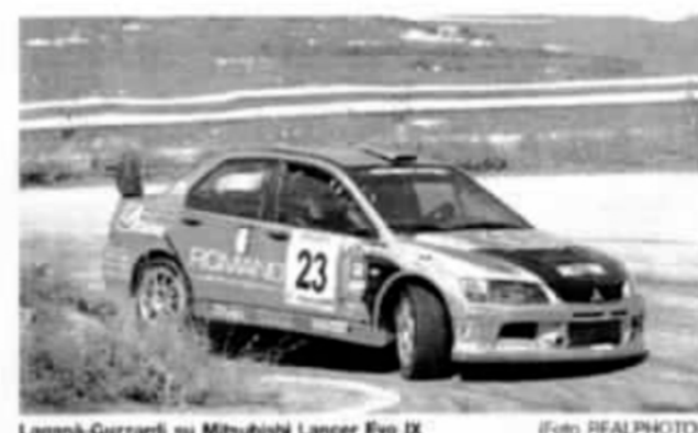
Laganà-Guzzardi su Mitsubishi Lancer Evo IX